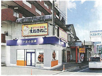
府中店の完成予想図

ほかに、「バターおおくな」 ザックザックカレーパンは、パンの周りにクルトンを貼り付けて揚げることで、具材の特製スパイス入りカレーにはごろっとしたジャガイモをたくさん詰められていることなど、見た目と味と食感が特徴的。カレーパングランプリ®では2020年から3年連続で金賞を受賞している。