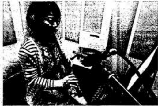
尺八や琴など和楽器を使った音源も増やしている(東京都品川区の東京オフィス)

楽曲の検索が容易 テンツを充実させ、利用者を増やしていく。楽曲の検索が容易 テンツを充実させ、利用者を増やしていく。楽曲の検索が容易 テンツを充実させ、利用者を増やしていく。