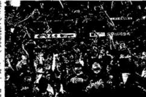
日本シリーズ第2戦で風船を飛ばす広島ファン(10月、広島市のマツダスタジアム)

中国電力は20日、プロ野球、広島東洋カープの客動員数の増加で、観戦チケット代などが増えたことなどから、カープの経済効果が、2018年は356億円に上ったと発表した。25年ぶりに優勝した16年の経済効果が258億円と前年比5億円増えた。「クラ イマックスシリーズ(CS)」と日本シリーズで