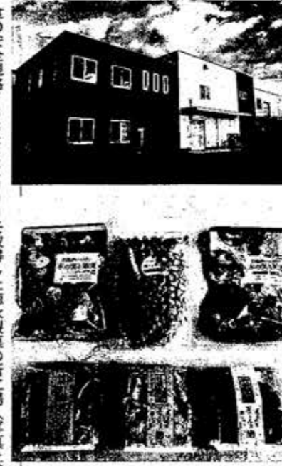
食の安全規格FSSC22000を取得した徳永製菓の新工場(写真上、広島県福山市)。同社はこれまでに約200種類もの豆菓子を開発してきた

豆菓子の老舗、徳永製菓(広島県福山市)は米国市場開拓に本腰を入れる。食の安全に関する国際規格を取得した第2工場を新設。ナッツ類をベースに小麦粉などグルテンを使わない新商品を開発し、豆菓子というより「健康スナック」として売り込む。2018年5月期に約4千万円だった輸出を5年で4億円超に引き上げ、うち2億円を米市場で稼ぎ出す考えだ。